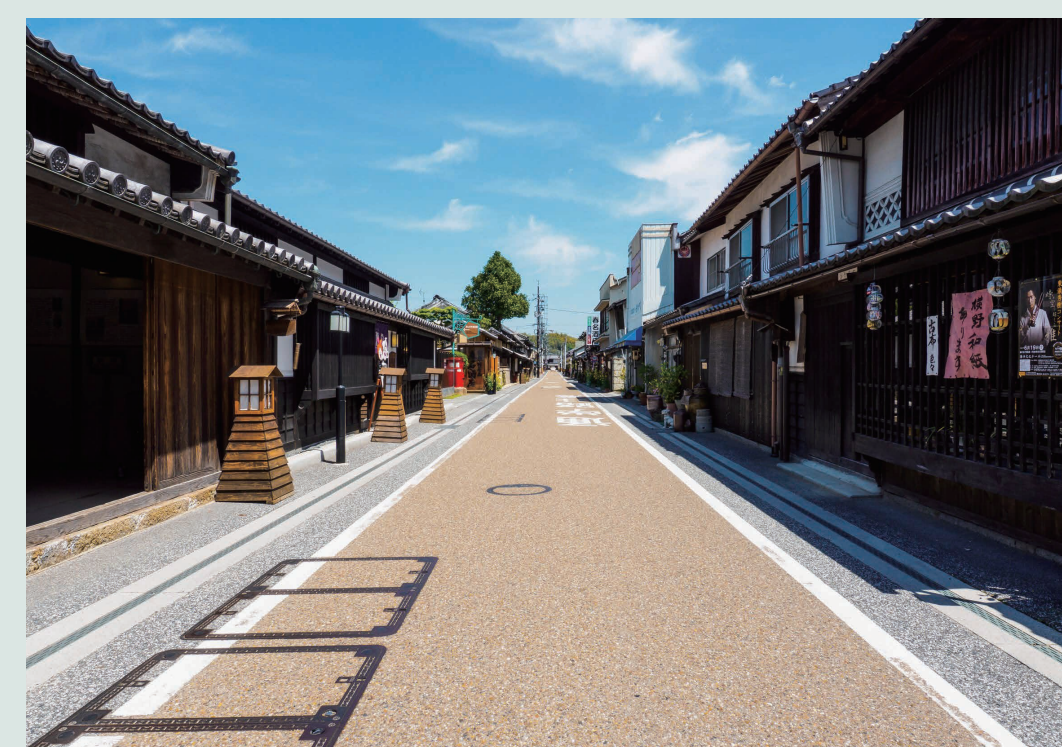
▲津山美都地区(城東街並み保存地区)